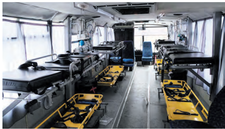
Уникальный реанимационный автобус для нужд фронта

Совместный проект фонда «Ленинградский рубеж» и Комтранса Ленобласти по модернизации гражданского транспорта