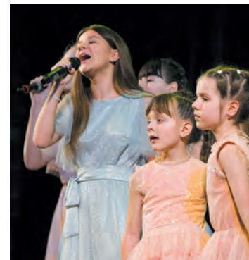
Концерт юных талантов Донбасса и Ленобласти

Помимо медицинской и социальной поддержки фонд «Ленинградский рубеж» не забывает и про образовательную составляющую. В течение прошлого года на передовой работали классы обучения на сварщиков в интересах наших ремонтных батальонов. Преподавателей сварочного мастерства из областных вузов пригласили в командировку на полтора-два месяца в зону СВО. Задача стояла непростая: превратить трёхлетний курс подготовки в интенсив на полтора-два месяца. Всё получилось. Ребята обучили, снабдили всем необходимым — так рембат получил новые рабочие руки!