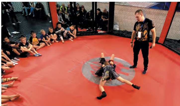
В Выборге спортсмены передают свой опыт подрастающему поколению