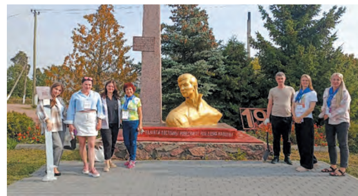
Жители Плодового обустроили территорию вокруг памятника неизвестному солдату