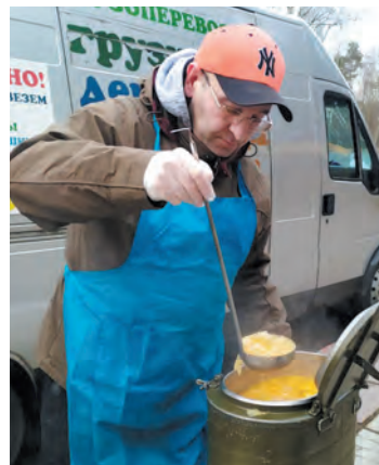
Волонтеры «Пятого угла» кормят бездомных

годняя», направленный на сохранение памяти о героях Великой Отечественной войны. Всё началось с небольшой патриотической акции в посёлке Плодовое Приозерского района. Местные добровольцы вместе со школьни-