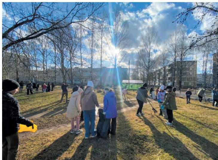
Ленинградцы вышли на первые субботники ещё до официального старта акции