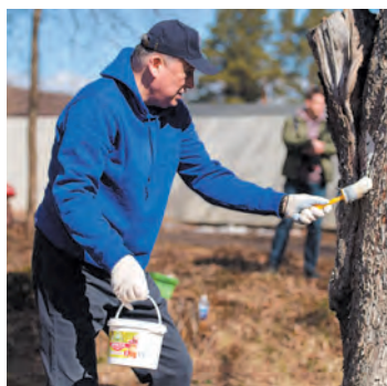
Акцию поддерживает руководство области

КСЕНИЯ БОНДАРЕНКО