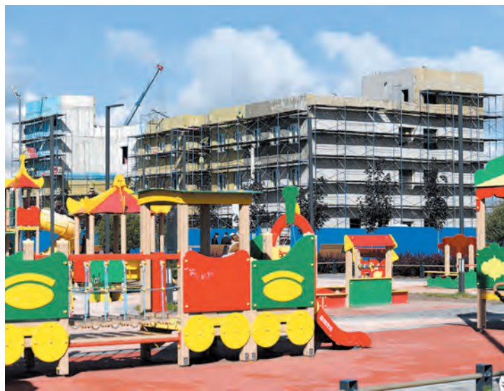
■ За 2023 год в Ленобласти сдали 25 социальных объектов

КСЕНИЯ БОНДАРЕНКО